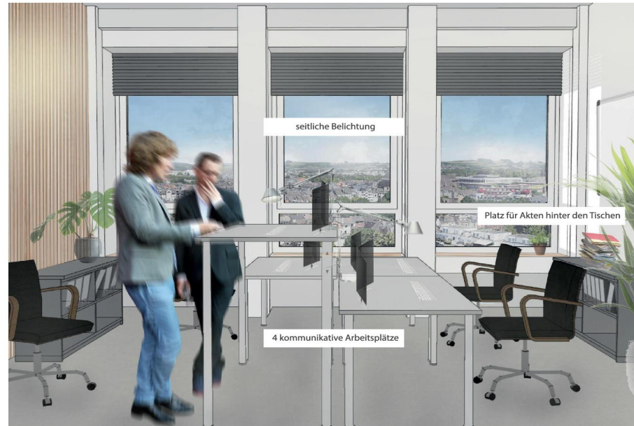
Visualisierung 3-achsiges Büro