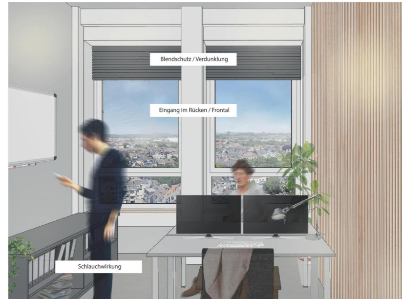
Visualisierung 2-achsiges Büro