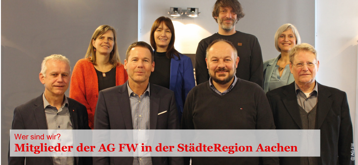
Wer sind wir? Mitglieder der AG FW in der StädteRegion Aachen