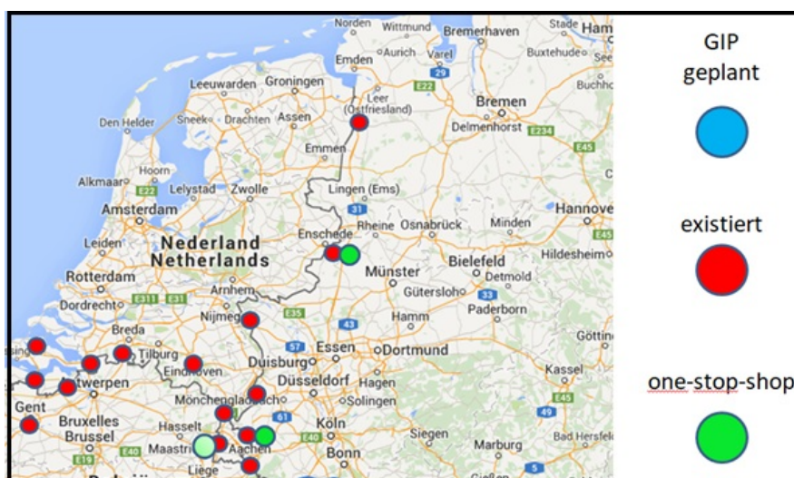
Übersicht der GIPs im Grenzgebiet B/D/NL

Seit Mitte 2016 kooperiert der GIP Aachen-Eurode mit dem „Service Grenzüberschreitende Arbeitsvermittlung/SGA“ (gemeinsames Vermittlungsbüro der Agentur für Arbeit, Jobcenter, UUV*, Podium 24*, WSP Parkstad*), welches im gleichen Gebäude (EBC) wie der GIP angesiedelt ist, so dass die Vermittlung und die Information/Beratung an einem Ort stattfinden kann (one-stop-shop-Prinzip).